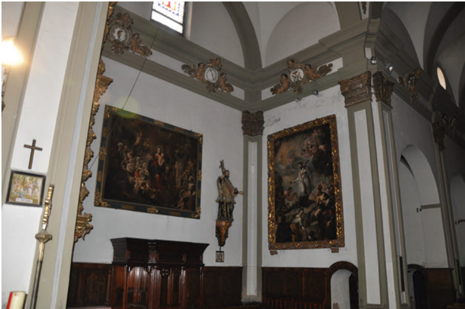
Fig. 10. Vista del brazo derecho del crucero de la iglesia del antiguo colegio de la Compañía de Jesús de Tudela, actual parroquia de San Jorge el Real.