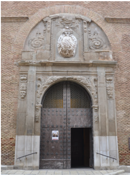
Fig. 6. Portada de la iglesia del antiguo colegio de la Compañía de Jesús de Tudela, actual parroquia de San Jorge el Real.