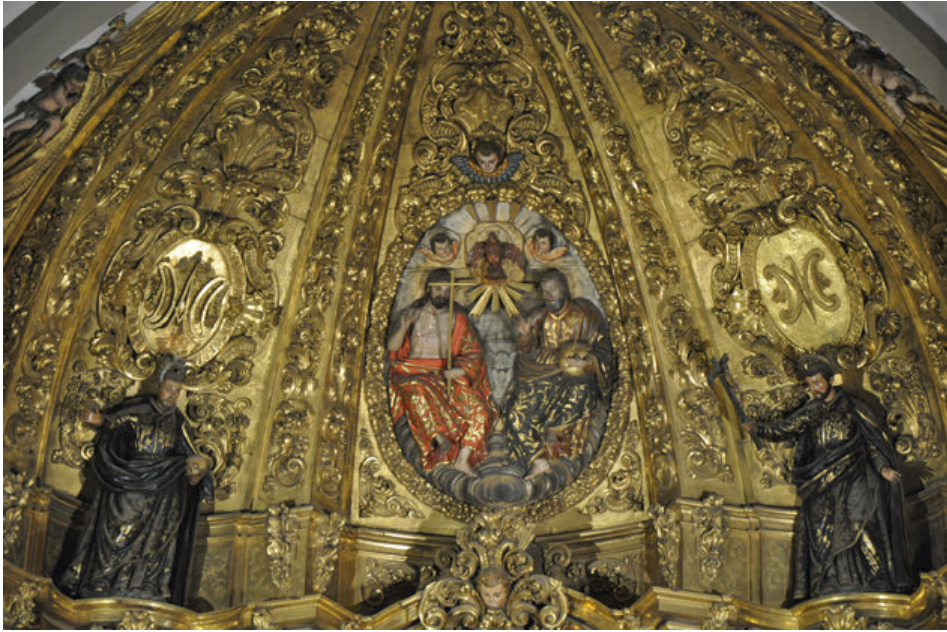
Fig. 9. Detalle del retablo mayor de la iglesia del antiguo colegio de la Compañía de Jesús de Tudela, actual parroquia de San Jorge el Real.