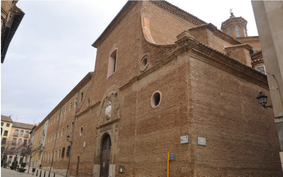
Fig. 5. Fachada de la iglesia del antiguo colegio de la Compañía de Jesús de Tudela, actual parroquia de San Jorge el Real.