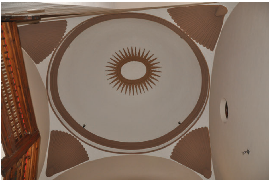
Fig. 13. Detalle de la bóveda de la caja de la escalera del antiguo colegio de la Compañía de Jesús de Tudela, actual Centro Cultural Castel Ruiz.