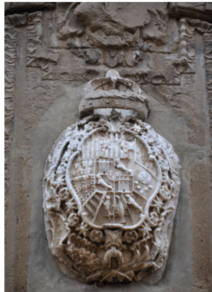
Fig. 7. Detalle del escudo real en la portada de la iglesia del antiguo colegio de la Compañía de Jesús de Tudela, actual parroquia de San Jorge el Real.